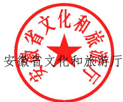
安徽省文化和旅游厅