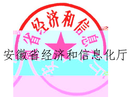
安徽省经济和信息化厅